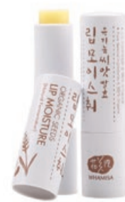
Vyživující balzám na rty, 4g, 405 Kč

Unikátní Balzám na rty z organických semínek z mangovým a kakaovým máslem zjemní a vyplní zvrásněné rty. Navíc obsahuje výtažky z ovesných a sójových bobů, které znasobují dlouhotrvající hydrataci a výživu.