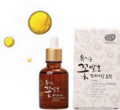
Pleťový pečující olej, 30 ml, 1495 Kč

Výživný krém pro denní i noční užítí se směsí mangového, kakaového, avokádového a bambuckého másla. Krásně se roztírá, okamžitě se vstřebává a pomáhá dosáhnout mladistvé a pružné pleti. Zajistí dlouhotrvající hydrataci a viditelně vyhlazení.