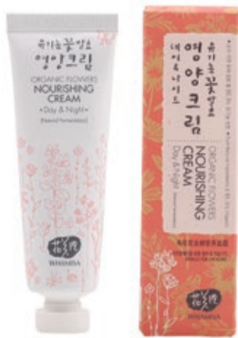
Výživný pleťový krém, 50 ml, 1295 Kč

I zimní období má svá specifika v péči o pleť. Je důležité ji hýčkat, ještě důležitější vyživovat, ale nezapomínat hydratovat. Kromě dvoufázového čištění a tonika (které Vás krásně dohydratuje a díky kterému Vám budou krémy lépe fungovat) doporučujeme obohatit péči o: